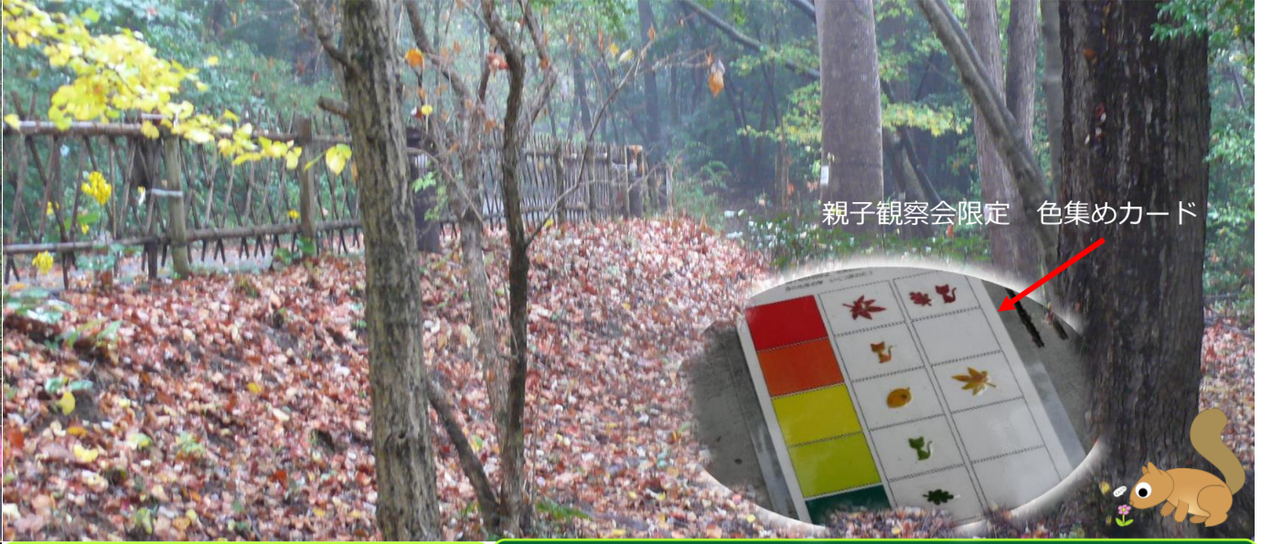
親子観察会限定 色集めカード