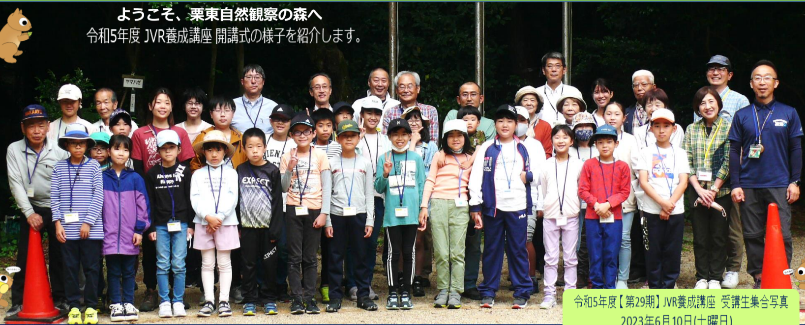
令和5年度【第29期】JVR養成講座 受講生集合写真 2023年6月10日(土曜日)

ようこそ、栗東自然観察の森へ 令和5年度 JVR養成講座 開講式の様子を紹介します。