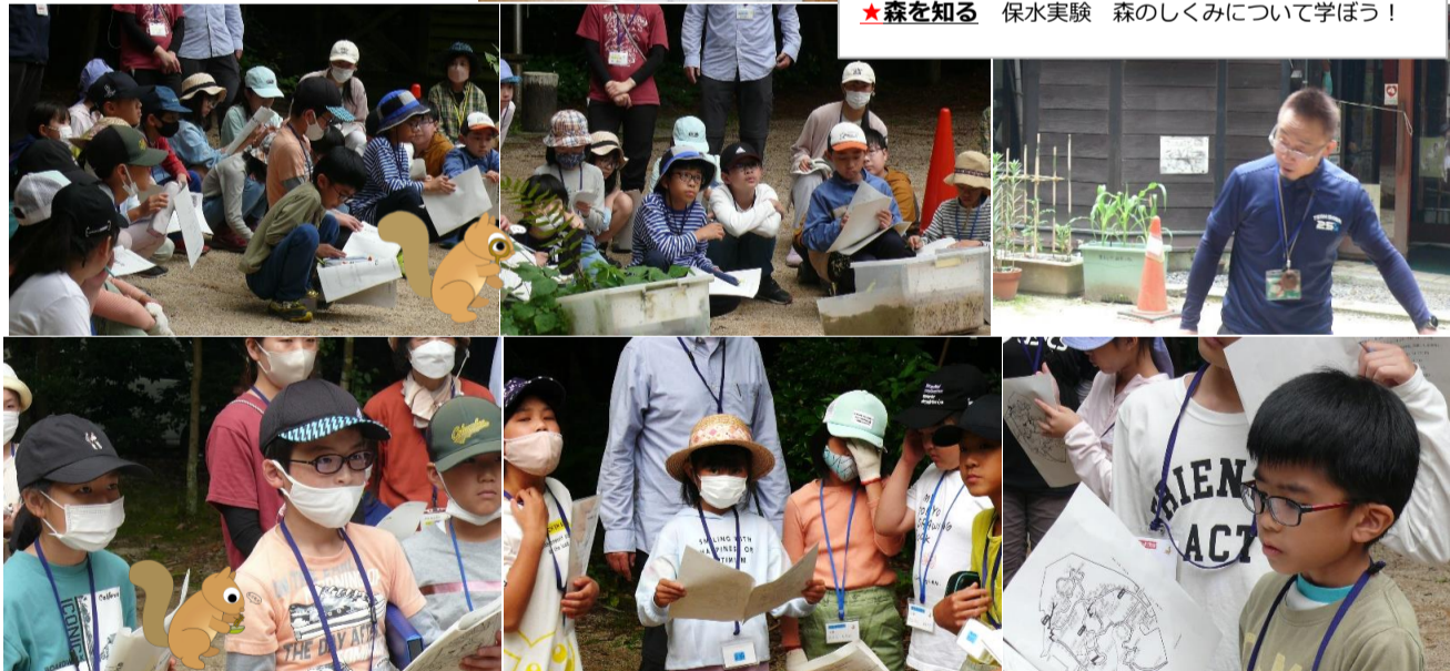
★実験をはじめる前に、各班の講座生を代表して、川のはじまりからどのような水が出るか発表していただきました。

「森林の持つ役割」を4つのキーワードで紹介すると、 ①森林は緑のダム ②森林は生きものの家 ③森林からの恵み ④森林は地球を救う になります。 これから紹介するお話は、森林の持つ役割の内、「森林は緑のダム」について考えます。これから行う実験は、保水実験といいます。実験装置に、森林のある山と森林のない山をつかって、そこに大雨を降らせませす。装置につけたノズルから流れ出る、川のはじまりの水の様子を比較します。流れ出る水の色、水の量、水のスピードについて推測してください。果たして、結果はどうなるのでしょうか?