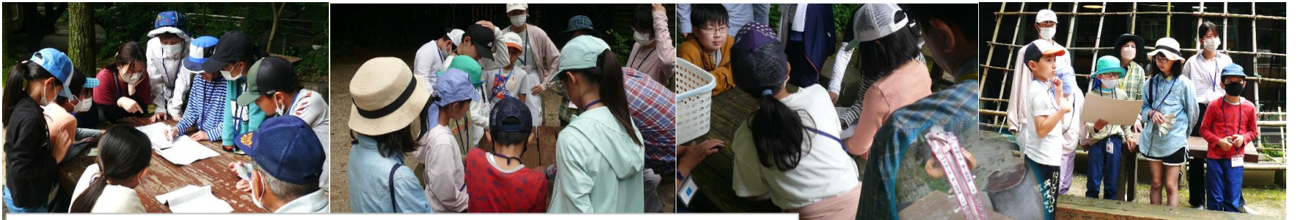
★アイスブレイク ③危険予知ゲーム 森の散策中に予測される危険を、リスクとハザードに分けて考えます。