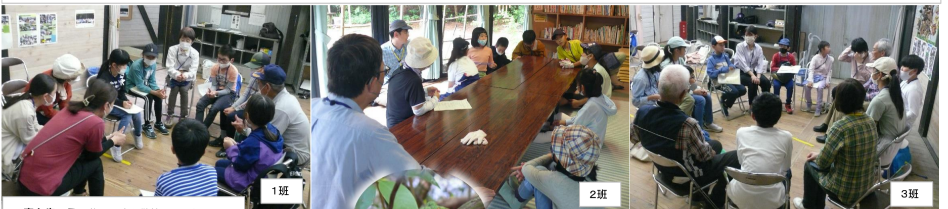
★森を歩こう 梅雨の森を散策しました♡