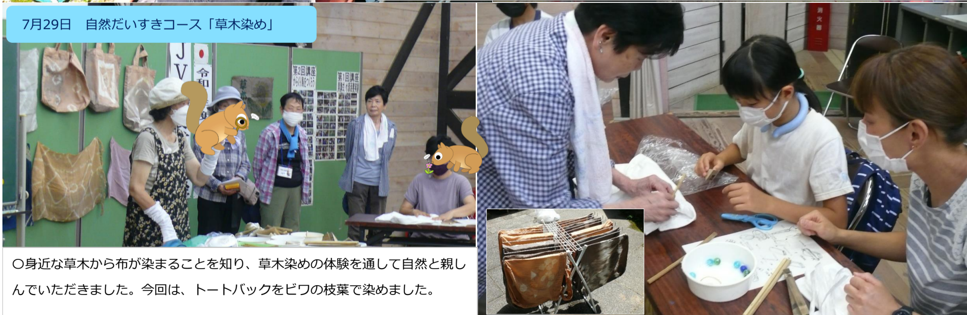
7月29日 自然だいきコース「草木染め」

○身近な草木から布が染まることを知り、草木染めの体験を通して自然と親しんでいただきました。今回は、トートバックをビワの枝葉で染めました。