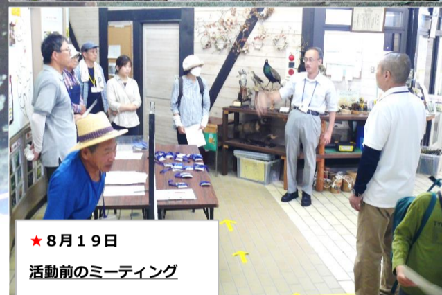
★8月19日 活動前のミーティング