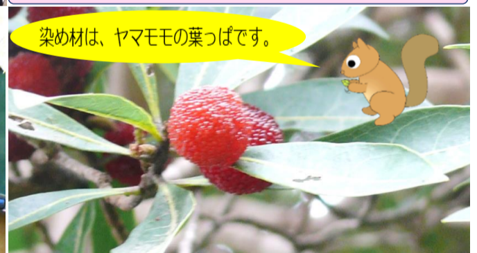
染め材は、ヤマモモの葉っぱです。