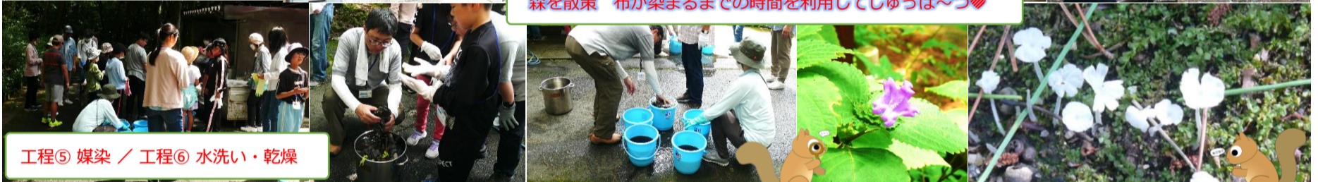
工程⑤ 媒染 / 工程⑥ 水洗い・乾燥