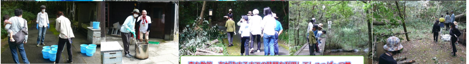
森を散策 布が染まるまでの時間を利用してしゅっぱ〜♡