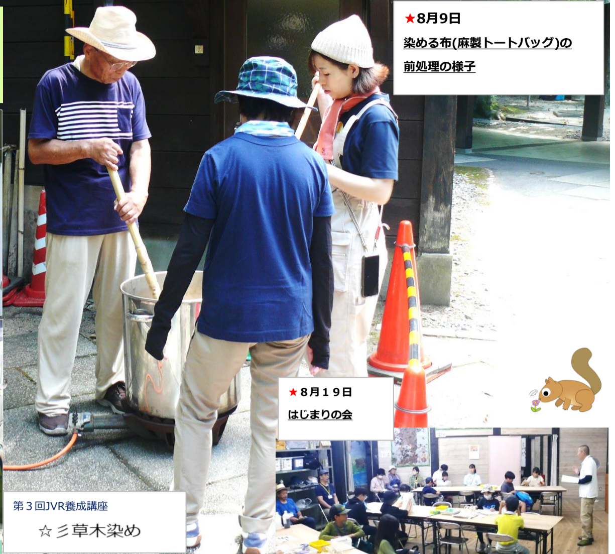
★8月9日 染める布(麻製トートバッグ)の 前処理の様子