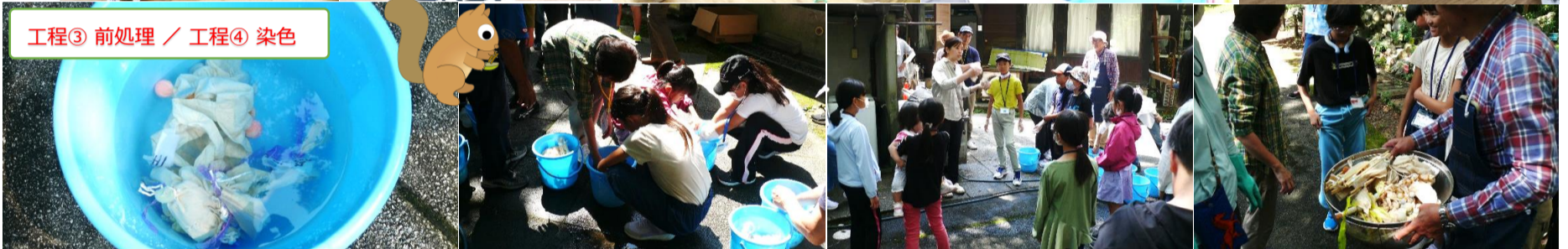
工程③ 前処理 / 工程④ 染色