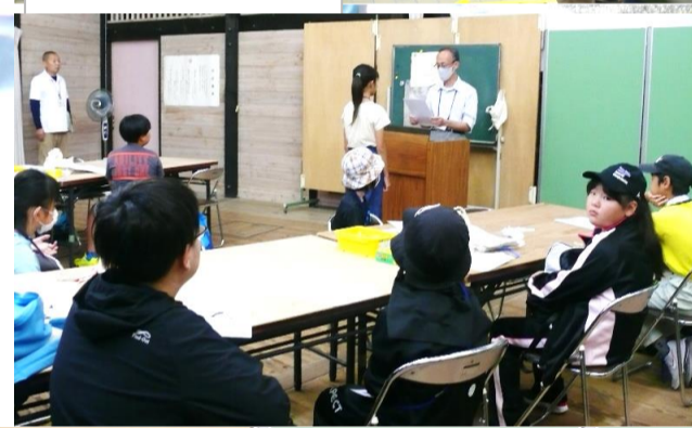
第3回JVR養成講座 ☆草木染め