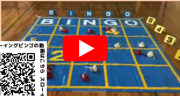
スローイングビンゴ(栗東市発祥)

栗東市スポーツ推進委員協議会では、ニュースポーツを楽しみたい方のお手伝いをしています。スポーツ推進委員の派遣を希望する方や、用具の貸し出しを希望される方は下記のお問い合わせ先へご連絡ください。