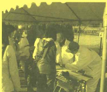
耐寒アベック登山大会

◎今年度は8月5日（金）に「夏期巡回ラジオ体操・みんなの体操会」が開催されます。