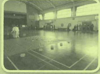
自治会へ派遣(花園自治会)→