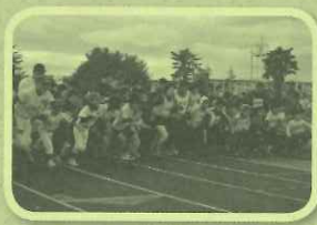
ロード競技三大会

第60回栗東クロスカントリー大会 ~くりちゃんファミリーマラソン~ 11月23日(木・祝) 野洲川運動公園 第61回耐寒アベック登山大会 1月21日(日) 金勝山一帯 第44回びわこ栗東駅伝大会 2月18日(日) 野洲川運動公園