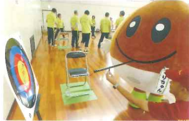
安全吹き矢! 高得点狙えるかな~

会場 栗東市民体育館 (問い合わせ スポーツ・文化振興課 TEL551-0318) 三人一組の18チームが参加し、スローイングビンゴ、ディスコン、安全吹き矢の三種目で順位を競います。応援よろしくをお願いします。(参加申し込みは終了しています)