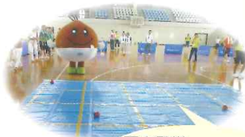
栗東発祥、スローイングビンゴ

抽選会、ニュースポーツ体験コーナーもあります!! (応援の方も参加できますよ~)