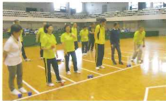
←スポ推委員もボッチャ研修(いきいき研修2018.6)