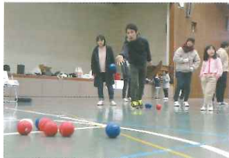
↑みんなで楽しめるスポーツ、ボッチャ