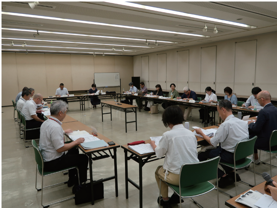
[写真 1-1] 委員会開催の様子