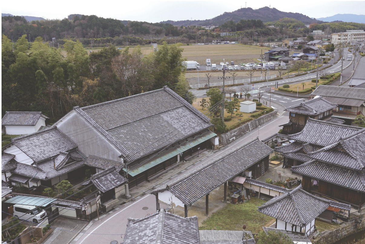
〔巻頭図版 6〕東海道沿いの屋敷構え（指定地北東上空より）