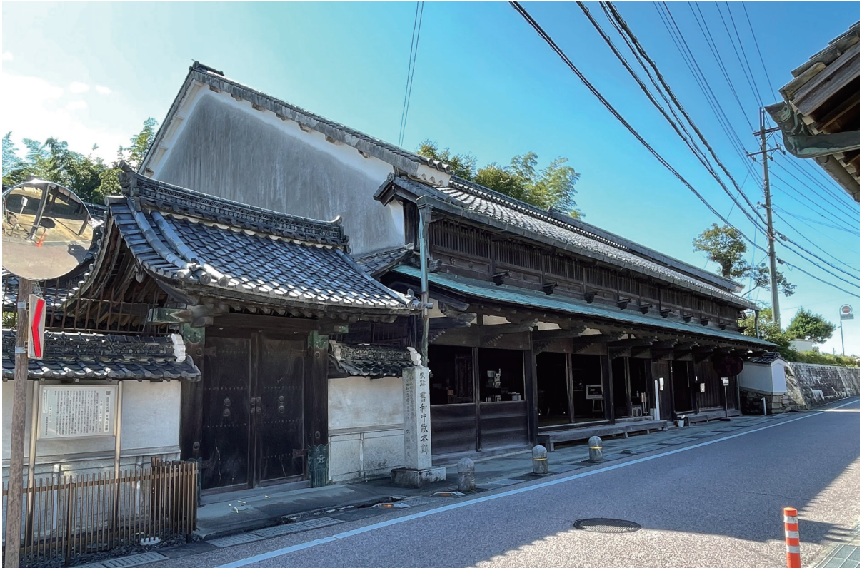
[巻頭図版 1] 主屋（東海道より）