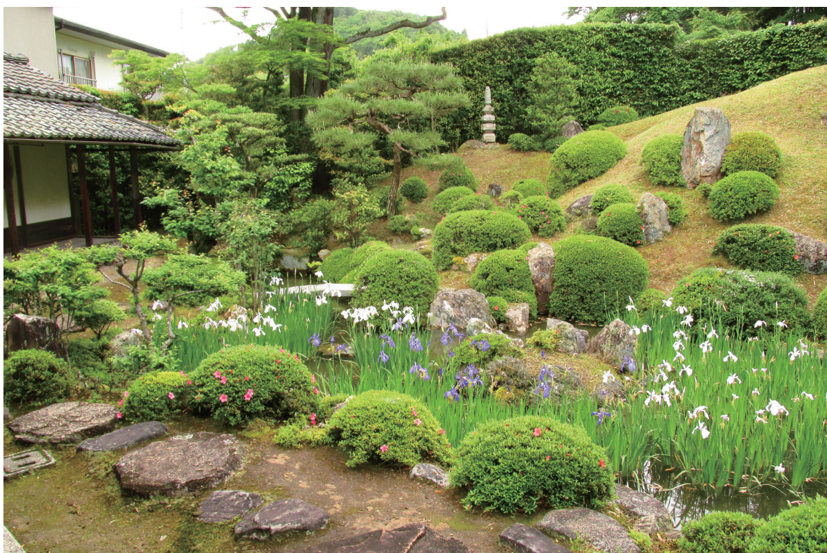
[巻頭図版 4] 主庭（上段の間付近より東方向）