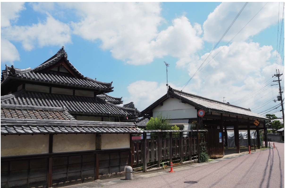
[巻頭図版 2] 隠居所・馬繋ぎ（東海道より）