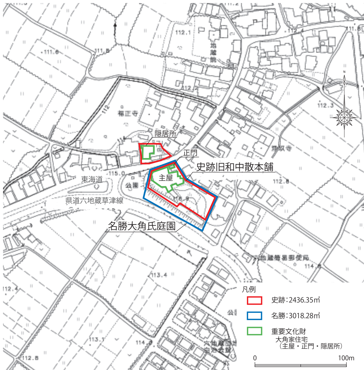
[図 1-2] 計画の対象範囲 (1 : 2,500) (栗東市都市計画課「地形図 010」に加筆)

本計画の対象範囲は、史跡旧和中散本舗及び名勝大角氏庭園の指定地を基本とする。ただし、史跡及び名勝の一体的な保存及び活用を推進するために、指定地をとりまく環境、周辺施設等を対象範囲に含めて検討する。本計画は今後20年を視野に、概ね10カ年の方針を示すものであり、所有者の意向や市の情勢によって計画期間に変更が生じる可能性がある。