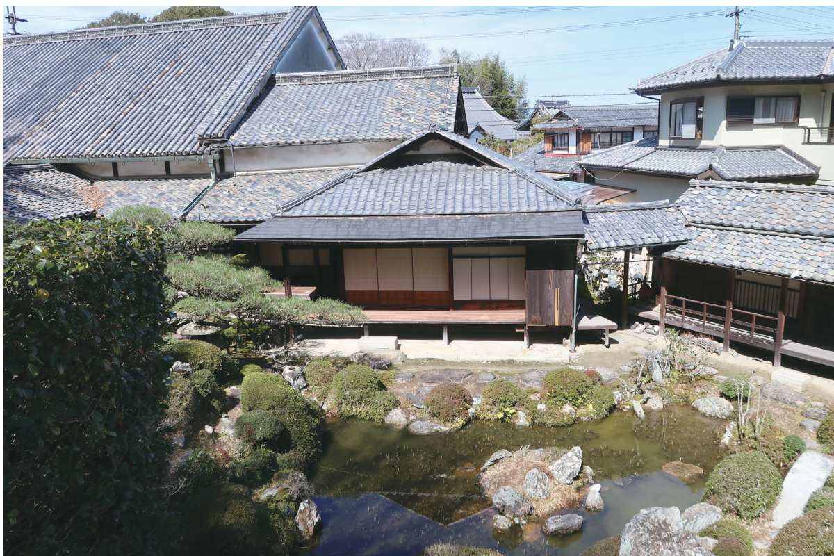
[巻頭図版 3] 主屋（築山より）