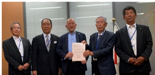
▲要請書を提出する湖南四市農業委員会代表者

昨年度に引き続き、「地域計画の策定により持続可能な農業・農村を創るために」をテーマに、農地の集積・集約化のほか、農業・農村の課題を幅広く汲み上げた政策提案を政府・国会へ要請するため議論されました。大会後には、それぞれの地元選出の国会議員に対して、決議された提案事項について要請書を提出しました。