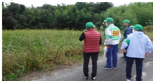
▲遊休農地をパトロールする委員・最適化推進委