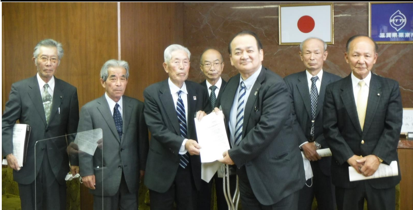
▲野村市長に意見書を提出する農業委員・農地利用最適化推進委員