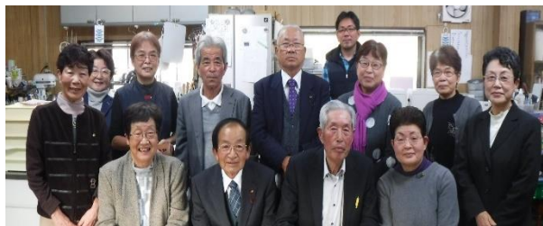
▲彦根市農業委員会女性部の皆さんと