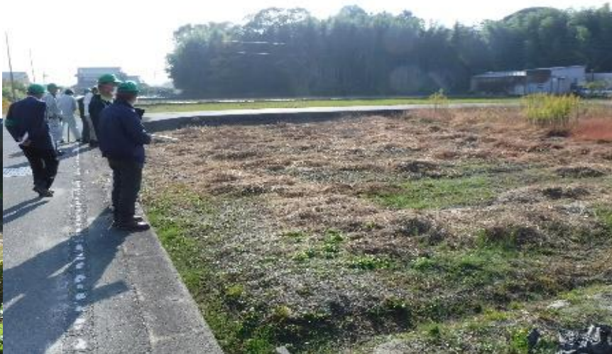
▲遊休農地をパトロールする委員・最適化推進委員