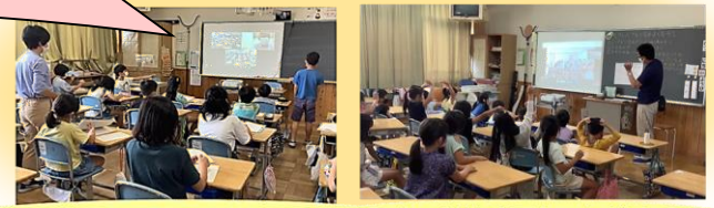
地域のお店や遠方の企業とつながる 他校の学校や園とつながる