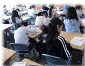
2 国語科で、丁寧に年賀状を書きました。