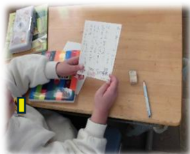
1 国語科で、思いを込めて年賀状を書きました。

子どもたちが目標に向かって元気に駆け抜け、心も体も飛躍するような、素敵な一年になることを願っています。