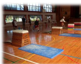
3 タブレットPCで撮影しながら技を磨きました。