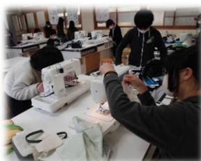
5 教え合いながらエプロンづくりをしました。