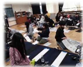
6 バランスを考えて画仙紙に書きました。