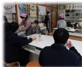
あおぞら 育てた野菜で肉じゃがを調理しました。大成功。