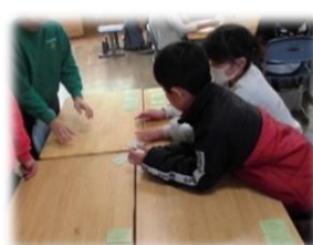
4 五色百人一首、グループで盛り上がりました。