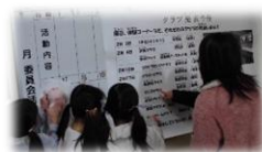
クラブ発表予告の掲示

2月末に4～6年生が取り組んできたクラブ活動の成果発表を行いました。クラブ発表の予定が掲示されると、どのクラブの発表を見ようかと朝から掲示板の前に集まっていました。クラブの活動内容を説明したり、体験できるように一緒に活動したりしました。下学年の子どもたちが、「じょうず!」「やってみたい。」と声があがりました。3年生からは「来年もこのクラブを作ってほしい!」とリクエストも出ていました。同好の仲間が集まり、自身の興味や関心を十分に追及し、この一年の活動した成果を発表できました。