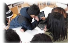
一緒に体験 プログラミング