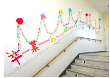
6年生の卒業を祝う掲示物

さて、明日から3月。今年度も残り一か月となりました。今週(2月26日)から本校は、「6年生卒業祝福週間」として祝福や感謝のメッセージを書いたり、掲示物にして貼り出したりし、卒業式に向けて気運を高めているところです。3月1日(金)には、児童会主催の「6年生今までありがとう会」を計画し、今学校では、呼びかけや合唱など、いろいろな形の「ありがとう」が廊下じゅう響き渡っています。