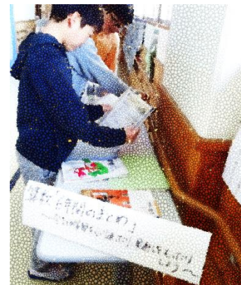
「これ懐かしい」教室前に並べられた低学年の算数教科書を手にする6年生

季節は寒暖を繰り返しながらも、着実に春に向かっていきます。校庭の桜の木も、少しずつ枝の色が赤くなり、開花の準備をしています。お子様たちには、進級することを楽しみにしながら、過ごしてほしいと思っています。