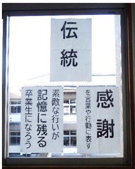
6年生教室前に掲示されている3学期の学年目標

今年の6年生は、学校や全校みんなに愛情や感謝の気持ちを持ち、最高学年として学校のことを考え、仲間とのつながりを大切にしながら学校生活を送ってきました。小学校生活6年間で学んだことや仲間と過ごしたことなど、それらのすべてがこれからの生活につながっていきます。卒業生みんなが、自分の目標に向かって、一步一步努力を積み重ね、いくつもの壁を乗り越えながら夢を実現していくことを心から願っています。3月19日(火)は、卒業式です。6年生にとって本校での「最後の授業」となります。61人の卒業生が、それぞれの船を力強く漕ぎ出せるよう、全校児童と教職員が一つ