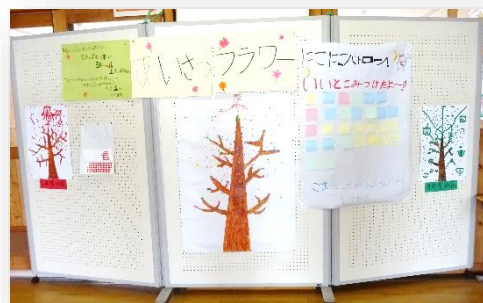
「あいさつフラワー」とやさしさ委員会による 「にこにこパトロール報告」

また、「あいさつフラワー」横には、やさしさ委員会による「にこにこパトロール報告」が掲示されています。この委員会では、長休みや昼休みに校内をパトロールし、仲良く過ごしている学級の様子や、誰かのために行動してくれた人など、本校のよいところを見つけて報告してくれています。パトロール報告のふせんも、ここ数日で少しずつ増えてきました。報告を読むと、心が温まります。この他、各委員会でもみんなの学校生活を向上させるための取組を、自分たちで考え実行に移しています。「先生や周りの大人が言うから…」というのではなく、自分たちの学校生活を見つめなおし、自ら考え、児童みんなで創り上げている姿は素敵です。ご家庭におかれましても、こういった児童会の取組についてお子様にお尋ねいただくとともに、今取り組んでいる「あいさつ」について、「なぜあいさつは大切といわれるのかな?」と、お子様に聞いていただくなどして、話題にしていただけでしたら幸いです。