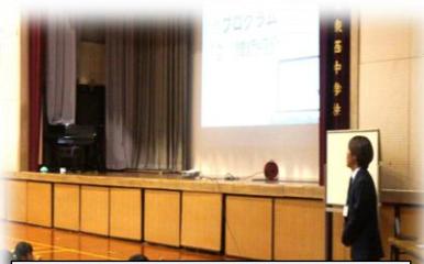
1年 障がい者差別問題