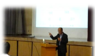
3年 在日コリアン差別問題