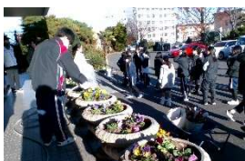
安養寺西自治会と花の植え替え

保護者の皆様、お忙しい中、三者懇談会へ出席いただきありがとうございました。今年も地域の皆様に支えられ、充実した2学期となりました。12月6日(土)には安養寺西区の自治会の皆さんと花の植え替えを行いました。エコロジー委員会の生徒と地域の方で