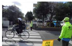
三者懇談会時の下校時見守り

寒いなか12名のサポーターさんが校門前に立ってくださり、挨拶の声掛けや一時停止とヘルメット着用の呼びかけをしてくださいました。元よく挨拶が返ってきましたが、ヘルメットの着用は以前に比べかなり少なかったです。自分の命を守るため意識してヘルメットを着用しよう。