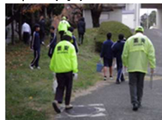
有志によるゴミ拾い清掃

60名近くの生徒が取り組みました。急な雨のためバタバタしましたが無事活動を終わりました。参加してくれた生徒達ありがとう。お忙しい中ご参加いただいたサポーターさんに感謝申し上げます。