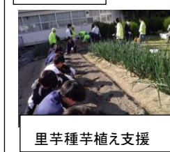
里芋種芋植え支援

サポーターご支援のもと、3年エコロジー委員で里芋種芋植えを実施しました。委員長あいさつのあと生徒たちは気持ちよく